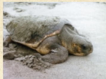
遠州灘海岸はアカウミガメが産卵する数少ない地域です。

■主催／科学技術振興調整費・遠州灘プロジェクトチーム 〔豊橋技術科学大学・東京大学・(財)土木研究センター〕 〔浜松ホトニクス(株)・本多電子(株)〕