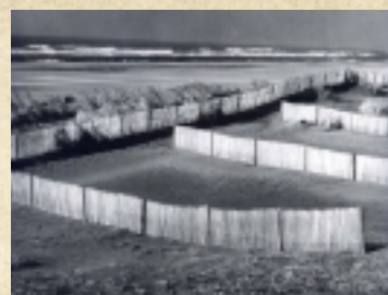
かつては広大な砂浜が広がっていました。