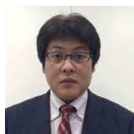
武蔵精密工業株式会社 研究開発部長