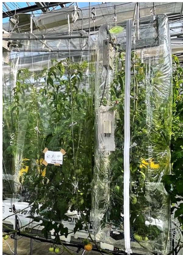
図3 光合成チャンバ