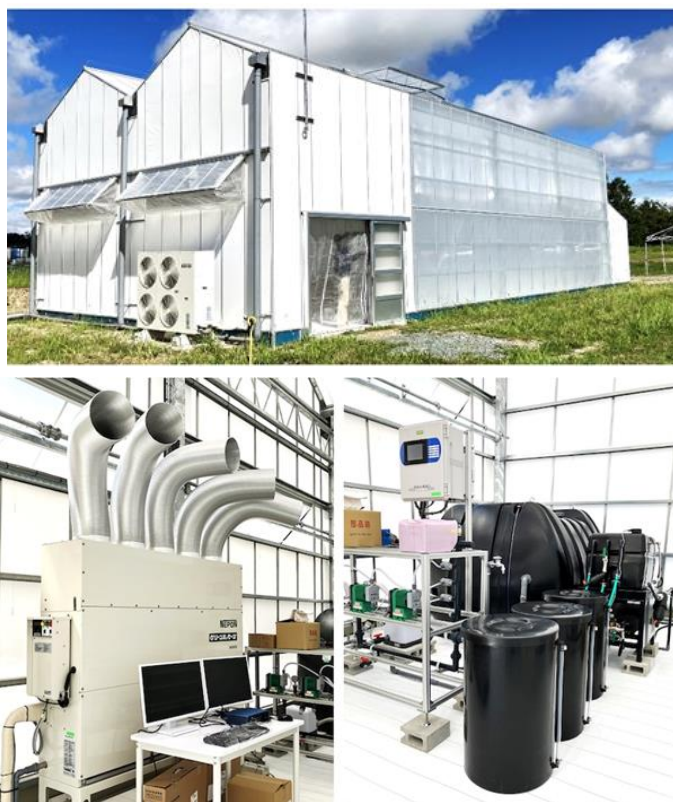
図1 セミクローズド温室の外観(上)と内観(制御室)(下)

「知の拠点あいち」内の実証研究エリアに設置したセミクローズド温室の外観と内観(制御室)を図1に示します。