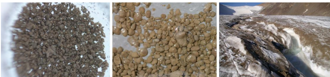
図2:(左)グリーンランドのクリオコナイト (中央)天山山脈のクリオコナイト (右)増殖したクリオコナイトが氷河表面を覆う様子

このように物質循環や氷河融解の観点から注目されてきたクリオコナイトですが、これまでの研究では一部の微生物やその微生物の生理機能しか調査されておらず、特に微生物群集のゲノムに関する情報はほとんどありませんでした。したがって、クリオコナイト内でどのような微生物種がどのような活動をしているのか、その実態はあまりわかっていませんでした。