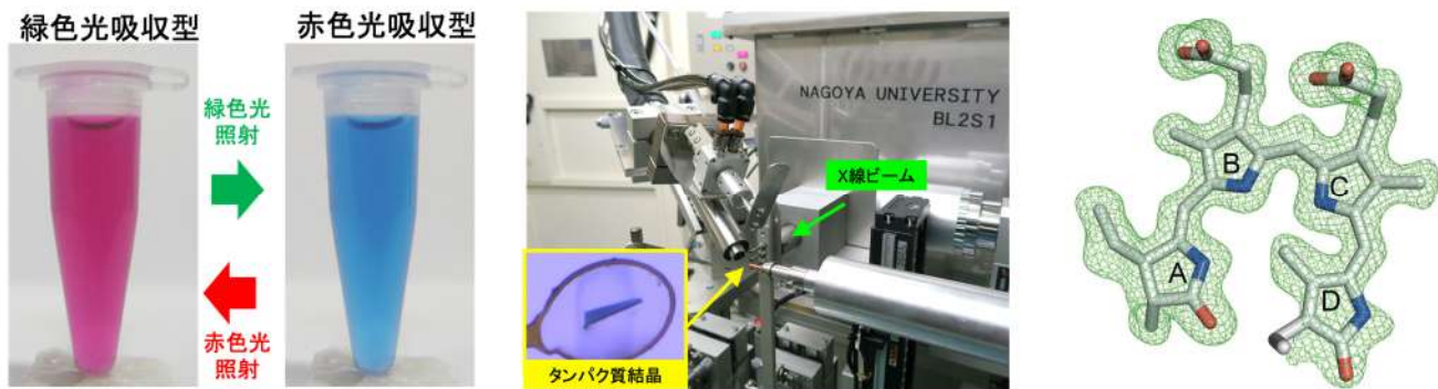
図1, RcaE タンパク質の光変換(左)、X線結晶構造解析に使用したあいちシンクロトン光センターの名大ビームラインと、赤色光吸収型の結晶(中央)、解析によって明らかとなったビリン発色団の構造(右)

今回の研究で得られた構造情報と、過去のアミノ酸置換変異実験との比較から、ビリン発色団と相互作用するアミノ酸残基の役割を理解することができました。今回の構造において予想外だったのは、RcaE のビリン発色団を格納するタンパク質ポケットに大きな「空隙」が存在したことです。ビリン発色団は、酸性アミノ酸残基を介して、空隙内部のクラスター化した水和水と水素結合を形成していました(図2)。分子動力学計算によって、それらの水和水が溶媒の水と素早く入れ替わることも示されました。このようなビリン発色団と溶媒水分子をつなぐ空隙は、これまでに発見された光スイッチタンパク質において見つけていません。我々は、RcaE の持つこの特徴的な構造を「穴あきバケツ(Leaky bucket)」構造と名付けました(図2)。この穴あきバケツ構造が RcaE の光変換反応におけるプロトンの通り道として機能しているのではないかと考えられました。