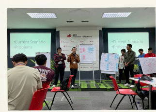
久留米高専3年 Mさん

実際に英語を使うことで、 必ずしも完璧な英語 でなくても、 自分の考えを伝えようとすることが大切 だと実感しました。 単語や簡単な表現でも、工夫すれば相手に伝わることを学びました。