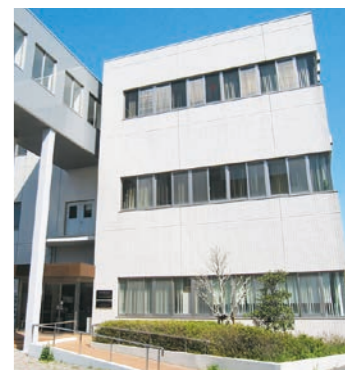
30 IRES 2 -2 (研究棟)

本学の強みである次世代半導体技術、センシング技術分野と、ロボティクス、情報通信、ライフサイエンス、農業工学、環境、防災、モビリティ等の応用分野との融合研究を行う研究所です。