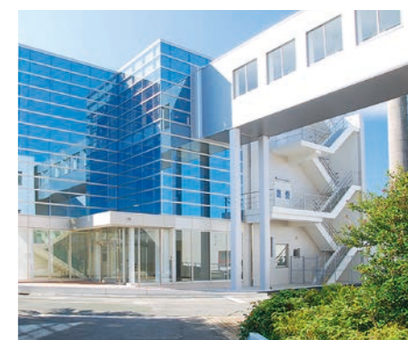
29 次世代半導体・センサ科学研究所(IRES 2 )

本学の強みである次世代半導体技術、センシング技術分野と、ロボティクス、情報通信、ライフサイエンス、農業工学、環境、防災、モビリティ等の応用分野との融合研究を行う研究所です。