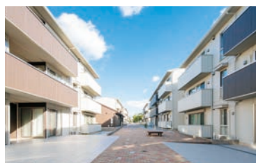
59 TUTグローバルハウス(G棟)