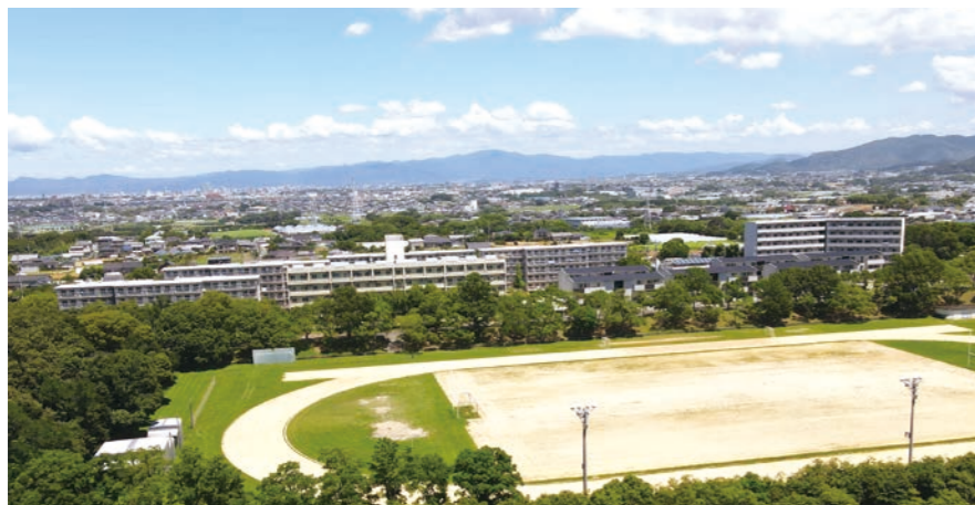
53~59 学生宿舎 [A~G棟]