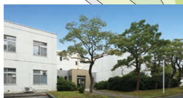
36 教育研究基盤センター

半導体集積回路(LSI)の設計から製造、評価まで一貫して行える世界トップクラスの研究開発施設です。様々な半導体技術と理工学分野の知見とを組み合わせ、先端的な電子デバイスを生み出しています。