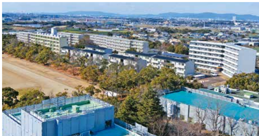
54~60 学生宿舎 [A~G棟]