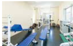
トレーニングジム(ウエイト系)