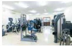
50 トレーニングジム