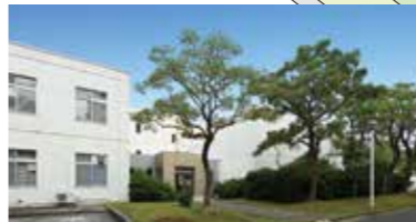
37 教育研究基盤センター 高度大型分析計測機器類、工作機械類などの共同利用機器を整備・管理・保守しています。