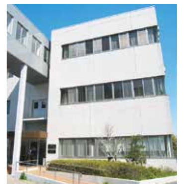
32 ベンチャー・ビジネス・ラボラトリー 半導体集積回路(LSI)の設計から製造、評価まで一貫して行える世界トップクラスの研究開発施設です。様々な半導体技術と理工学分野の知見とを組み合わせ、先端的な電子デバイスを生み出しています。