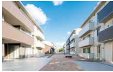
60 TUTグローバルハウス(G棟)