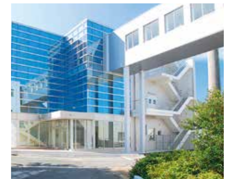
30 次世代半導体・センサ科学研究所 本学の強みである次世代半導体技術、センシング技術分野と、ロボティクス、情報通信、ライフサイエンス、農業工学、環境、防災、モビリティ等の応用分野との融合研究を行う研究所です。