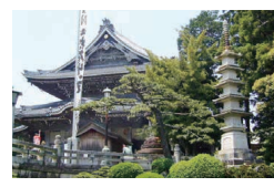
豊川稲荷 日本三大稲荷の豊川稲荷は、「商売繁盛」の神として知られている。