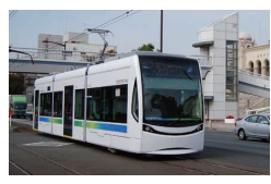
市電 市民に愛され、今も「市電」と呼ばれる豊橋の路面電車。