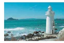
伊良湖岬 渥美半島の先端に位置し、「常春のリゾートエリア」として知られる。