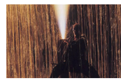
吉田(豊橋の旧名)の花火 「三河古老伝」などの古文書に手筒花火の発祥の地と記されている。